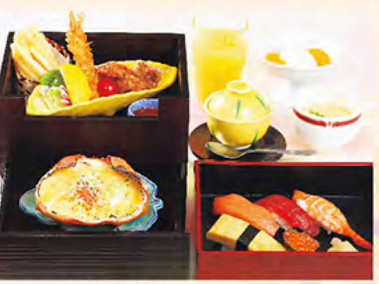
のあそび 1,580円(税サ別)