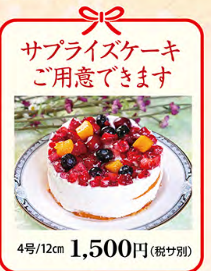
サプライズケーキ ご用意できます 4号/12cm 1,500円(税サ別)

《お食い初め》 子どもが乳歯の生えはじめる生誕百日に、一生涯食べる事に困らないようにとの願いを込めて食事の真似をさせる、平安時代から受け継がれている儀式です。お膳に乗っている小石は歯が早く丈夫になるようにとの願いがかけられています。