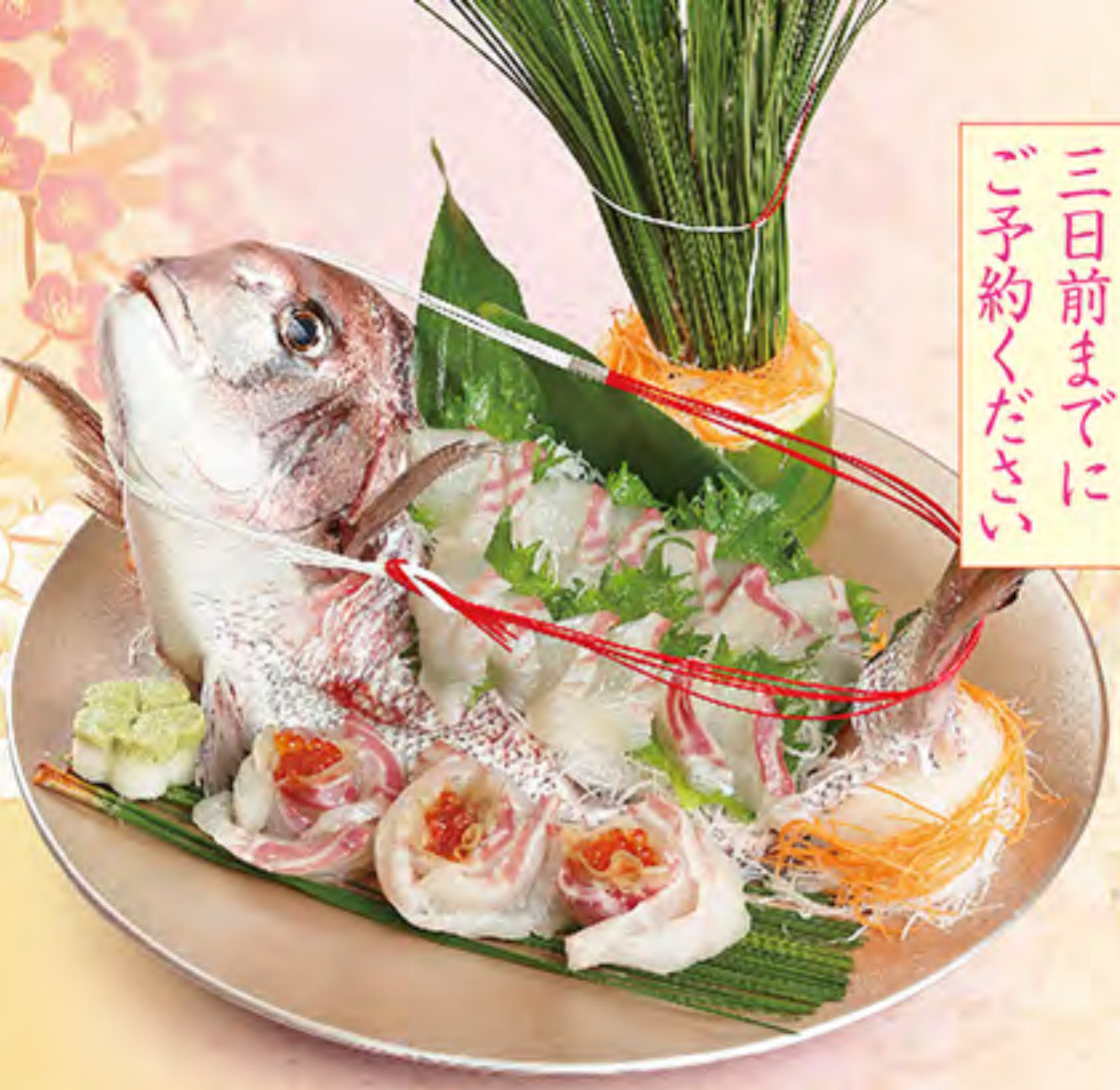
がんこ鯛姿造り 5,000円(税サ別)