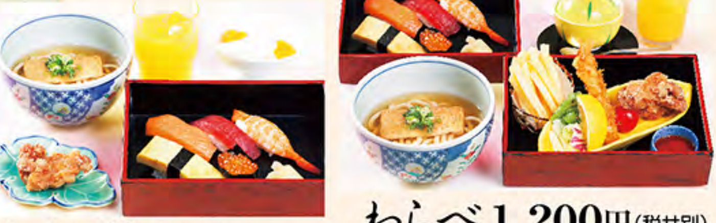
わんぱく 800円(税サ別)