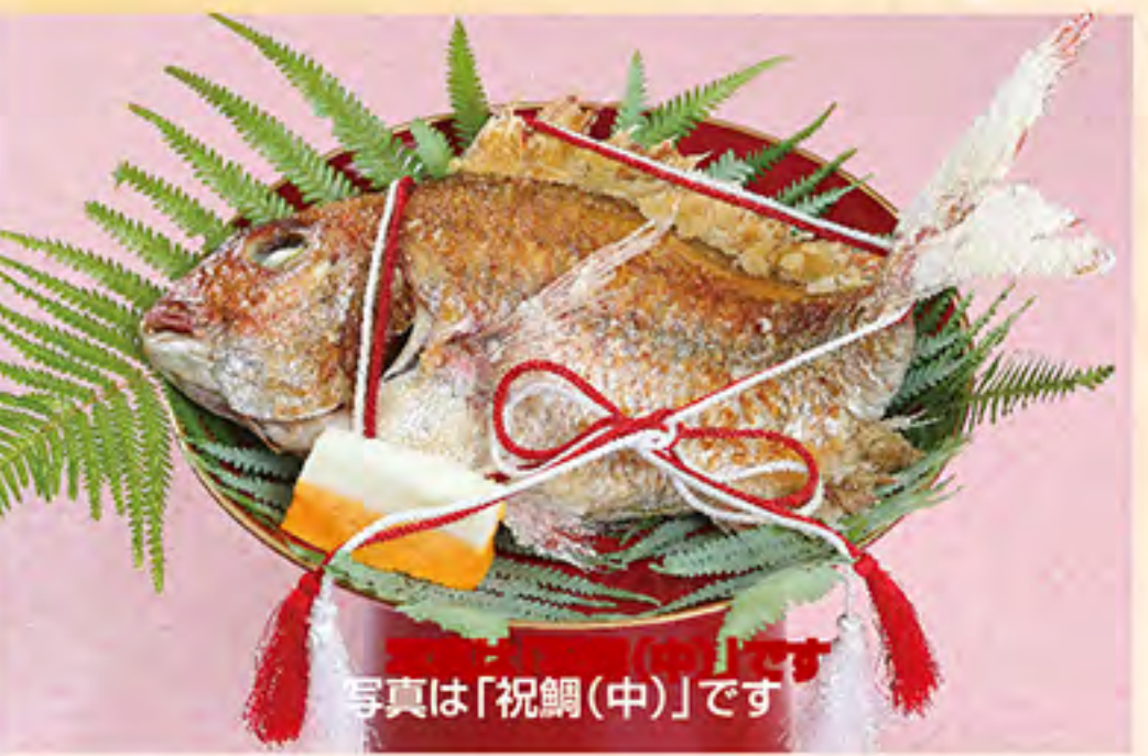
祝鯛(中) 3,000円(税サ別) 祝鯛(大) 5,000円(税サ別)