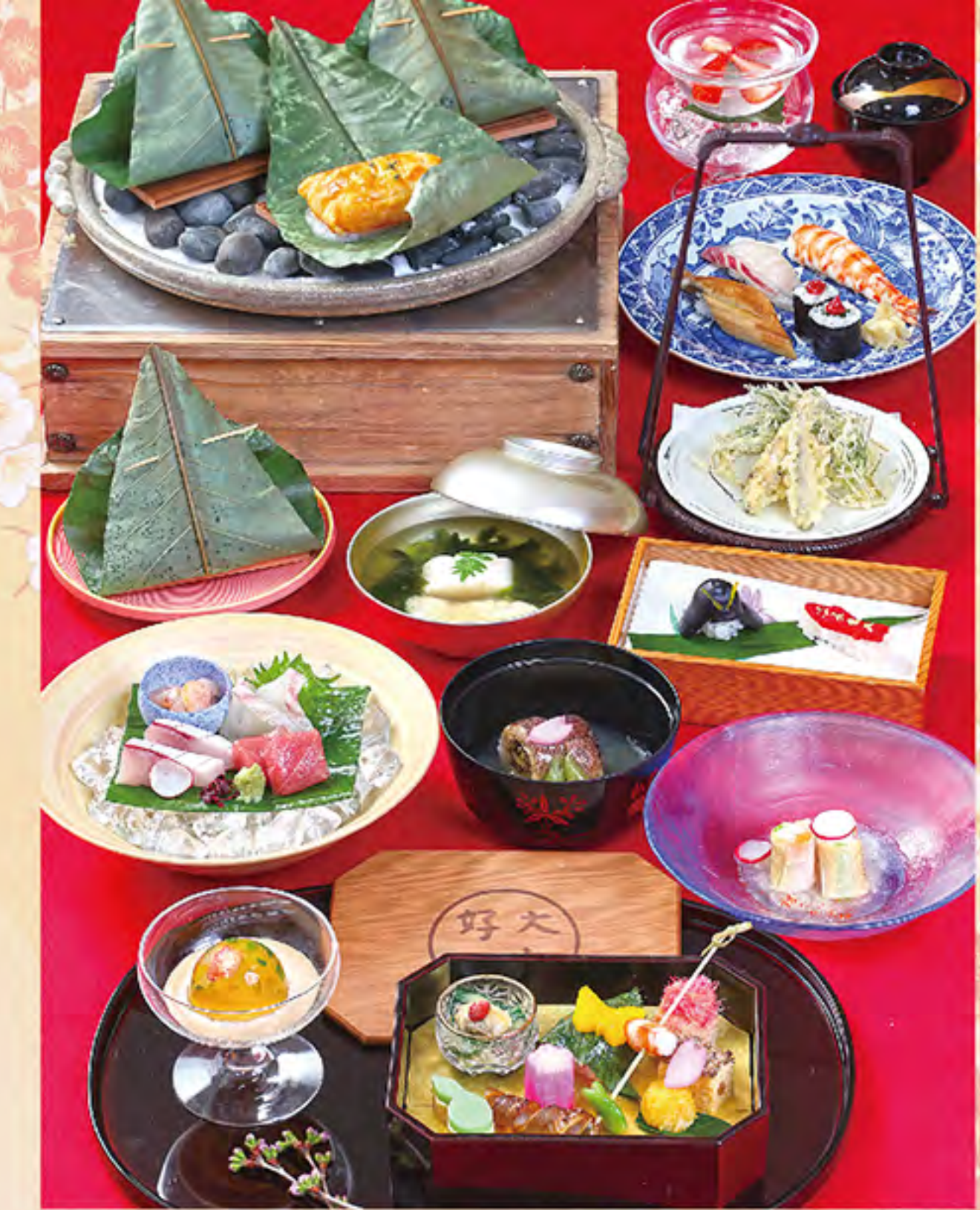
写真は「にしき」です ※献立は季節により変わります