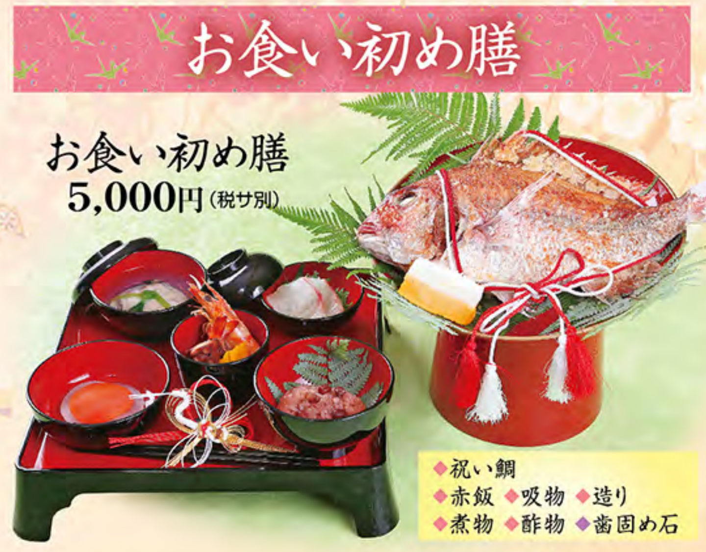
お食い初め膳 5,000円(税サ別)

お祝いの席に花を添えるお料理を、お値打ち価格でご用意いたします。 三日前までにご予約ください