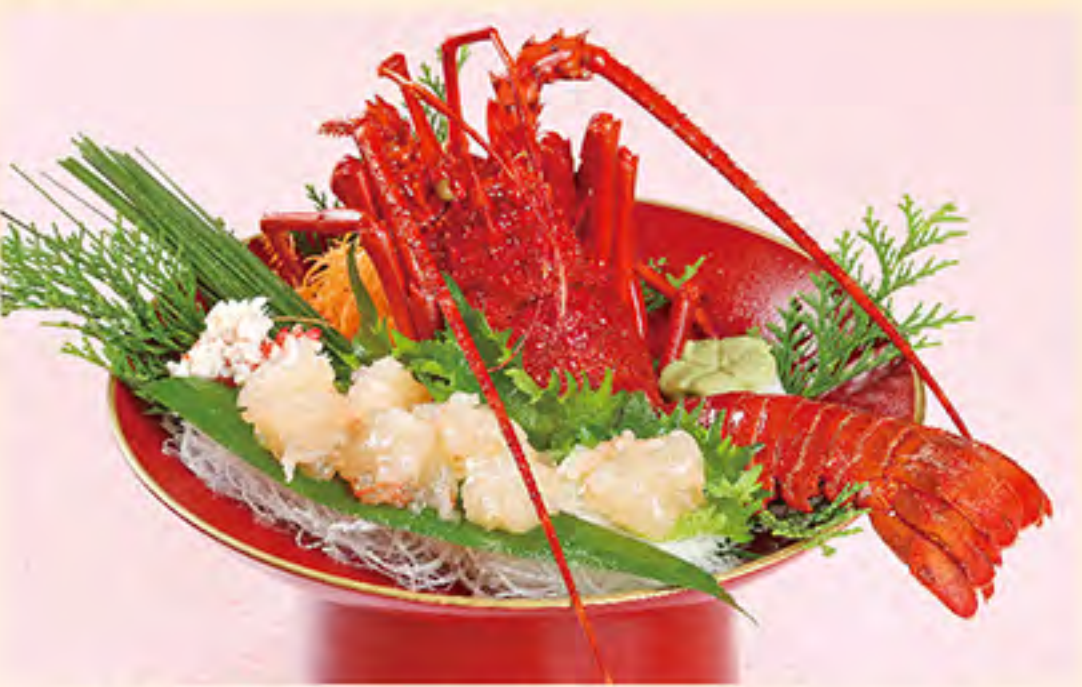
伊勢えび姿造り 7,000円(税サ別)

《お食い初め》 子どもが乳歯の生えはじめる生誕百日に、一生涯食べる事に困らないようにとの願いを込めて食事の真似をさせる、平安時代から受け継がれている儀式です。お膳に乗っている小石は歯が早く丈夫になるようにとの願いがかけられています。