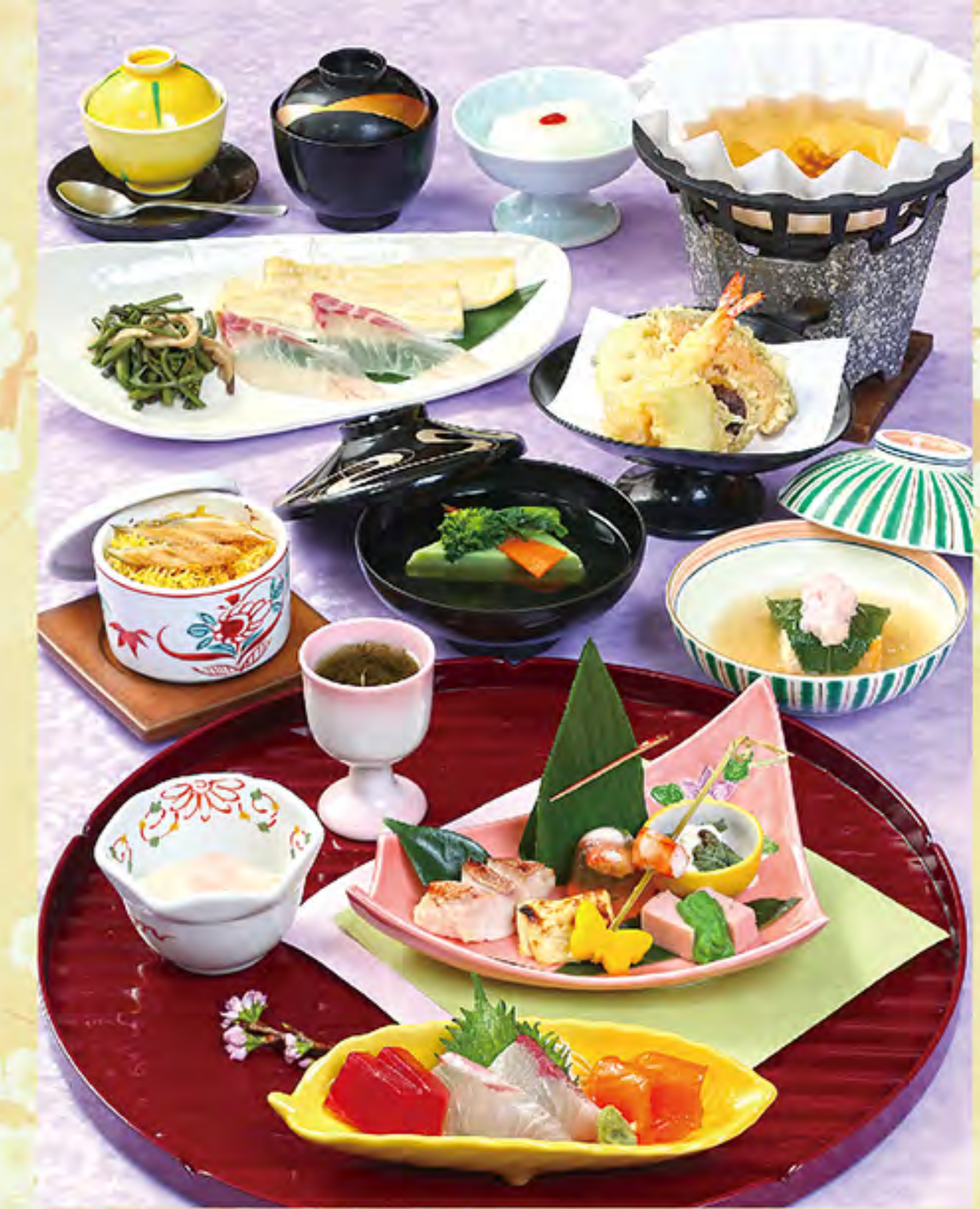
写真は「魚しゃぶけやき」です ※献立は季節により変わります