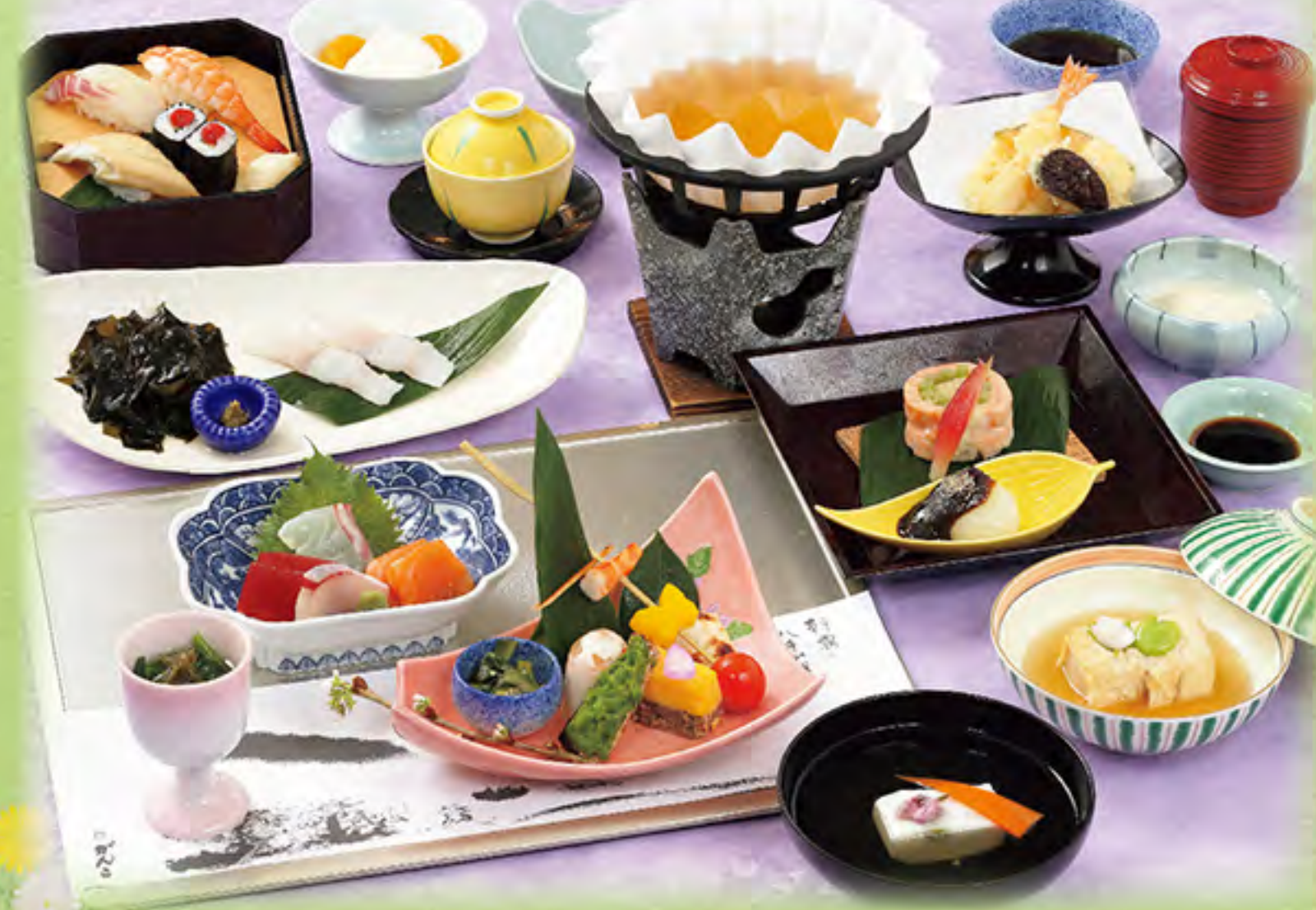
写真は「嵯峨」です ※献立は季節により変わります

ご法要 (仏式) 中陰法要 初七日 (逝去してから七日め) 二七日 (逝去してから十四日め) 三七日 (逝去してから二十一日め) 四七日 (逝去してから三十一日め) 五七日 (逝去してから三十五日め) 六七日 (逝去してから四十二日め) 七七日 (逝去してから四十九日め) 百か日 (逝去してから百日め) 新盆 (七七日の忌明けの初めを迎える盆) 初彼岸 (逝去してから最初の彼岸) 年忌法要 (一周忌から百回忌) 一周忌 (逝去した翌年の祥月命日) 三回忌 (逝去して満二年目の祥月命日) 七回忌 (逝去して満六年目の祥月命日)