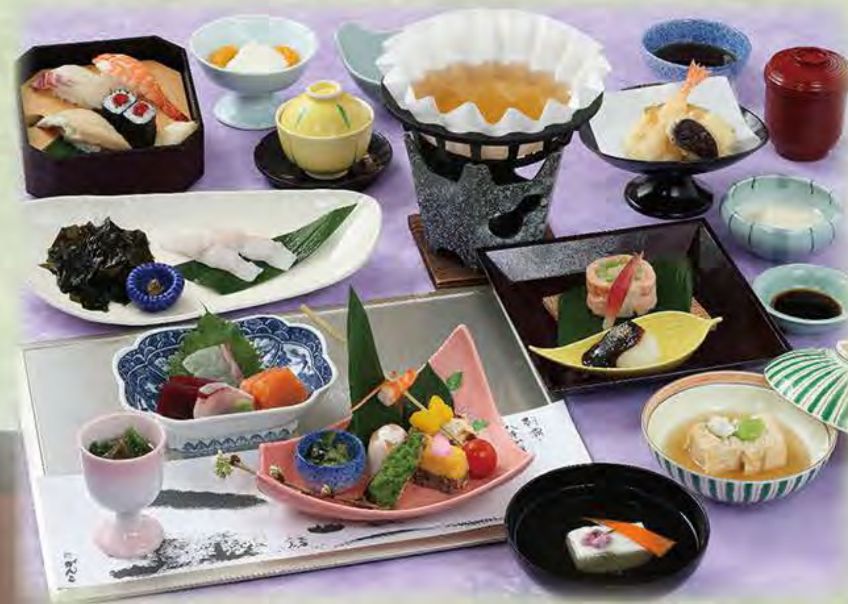
写真は「嵯峨」です ※献立は毎月変わります

お部屋どり、お料理、人数、ご予算に応じて ご用意させていただきます。お気軽にご相談ください。