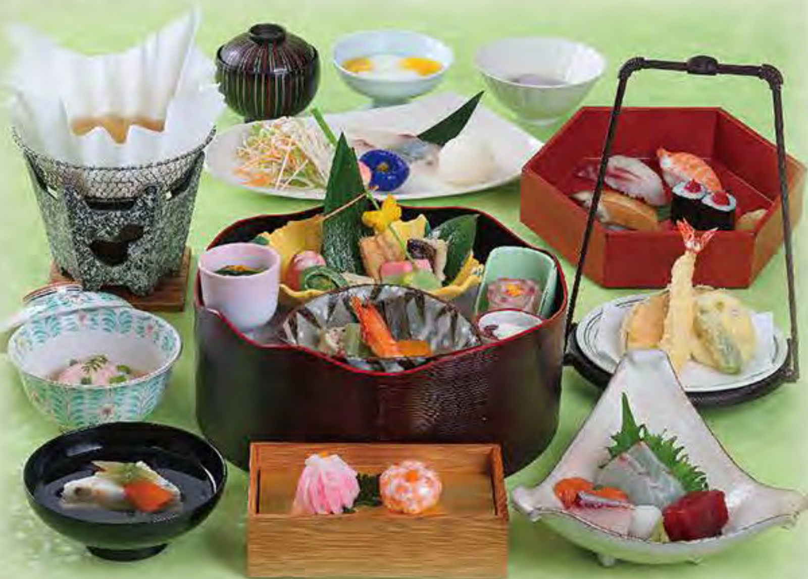
写真は「醍醐」です ※献立は毎月変わります