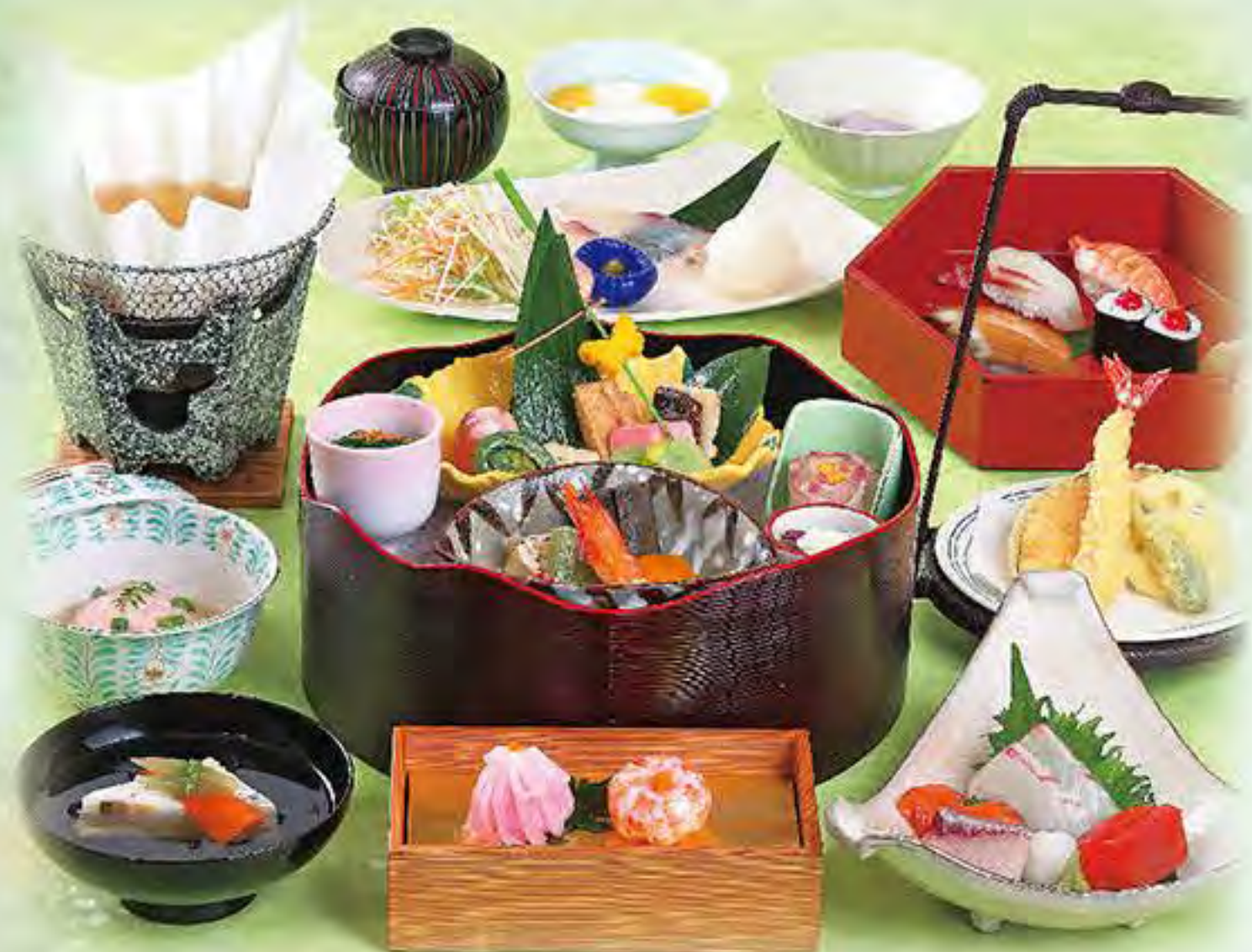
写真は醍醐です。※献立は毎月変わります。

がんこのご法要 ご法要はご家族の皆様にとって大切な機会 がんこでは少しでもお力添えができるよう ご予算、ご要望にお応えしております。 また、お供えや引き出物に關しても ぜひご相談ください。 ご法事の一日が心温まる集いになりますよう 心よりお祈り申しあげます。