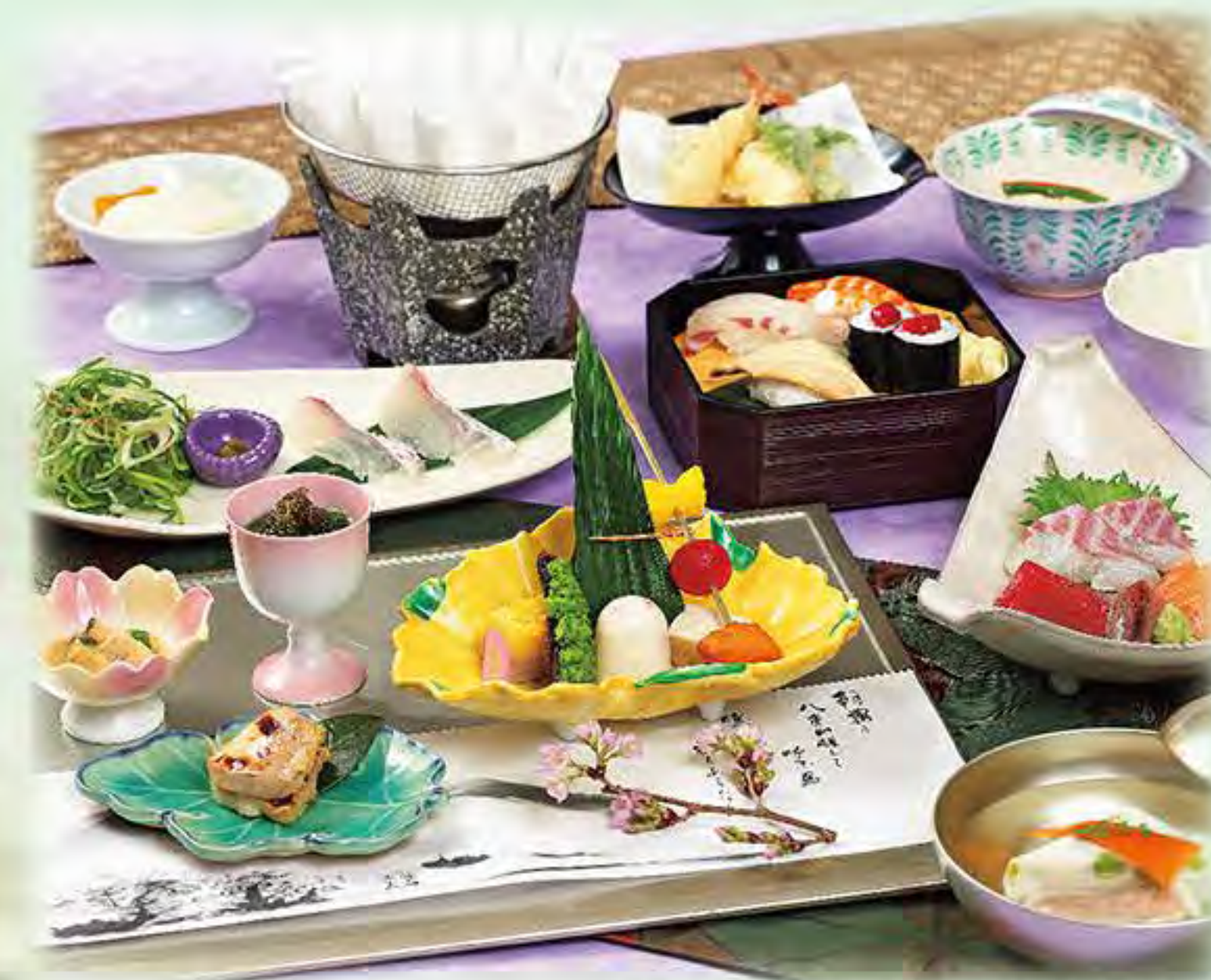
写真は嵯峨です。※献立は毎月変わります。

がんこのご法要 ご法要はご家族の皆様にとって大切な機会 がんこでは少しでもお力添えができるよう ご予算、ご要望にお応えしております。 また、お供えや引き出物に關しても ぜひご相談ください。 ご法事の一日が心温まる集いになりますよう 心よりお祈り申しあげます。