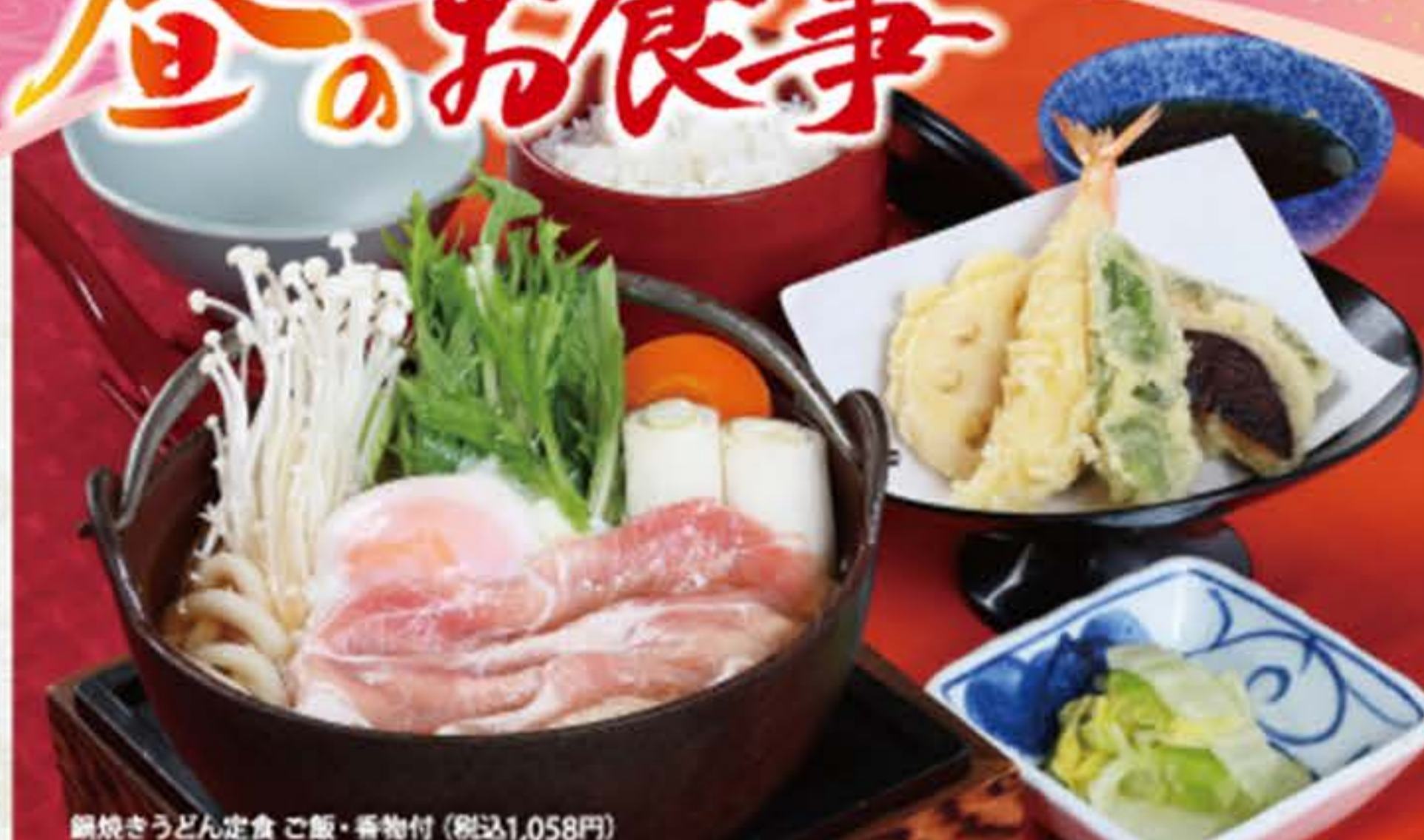
鍋焼きうどん定食 ご飯・香物付 (税込1,058円)