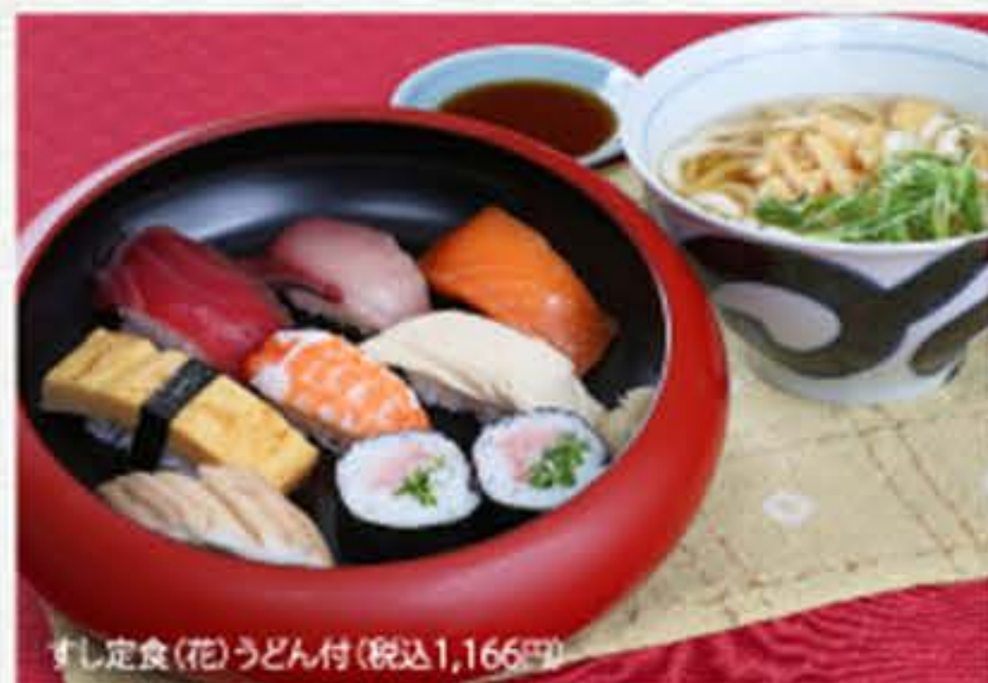
すし定食(花)うどん付(税込1,166円)