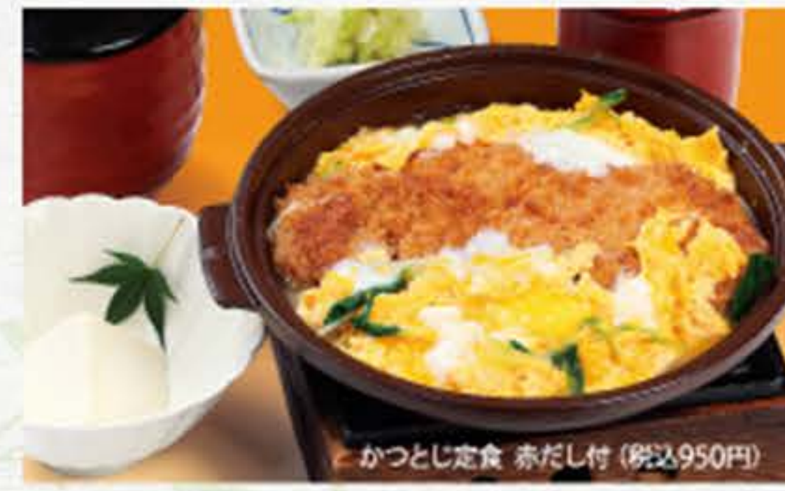
かつとじ定食 赤だし付(税込950円)

赤だし付 780円 (税込842円) うどん又はそば付 980円 (税込1,058円) ぶり造り・赤だし付 1,080円 (税込1,166円)