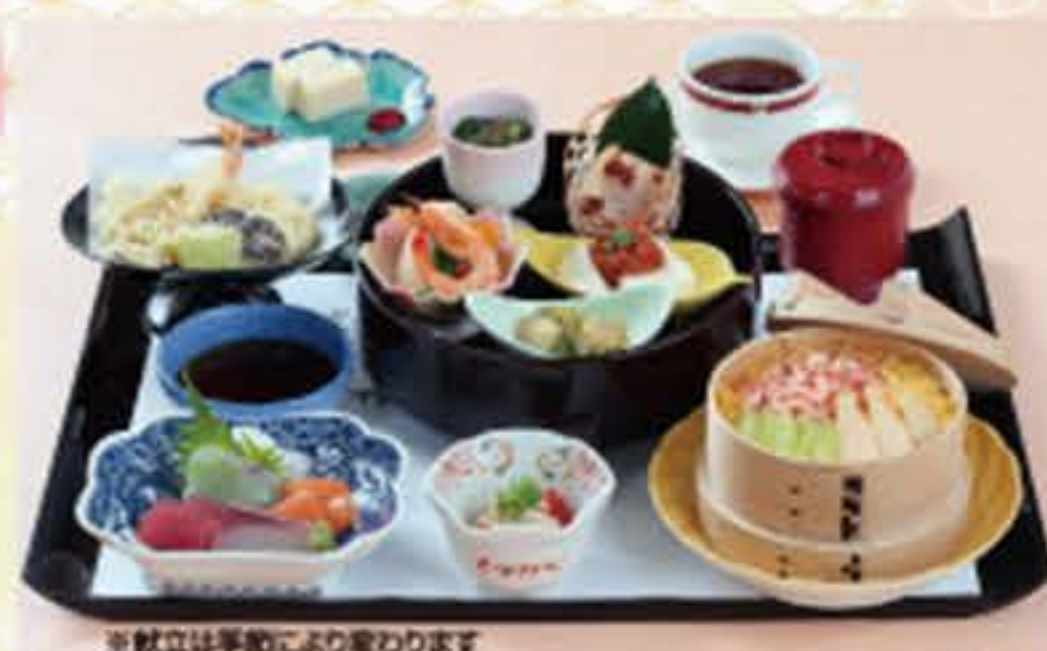
※献立は季節により変わります