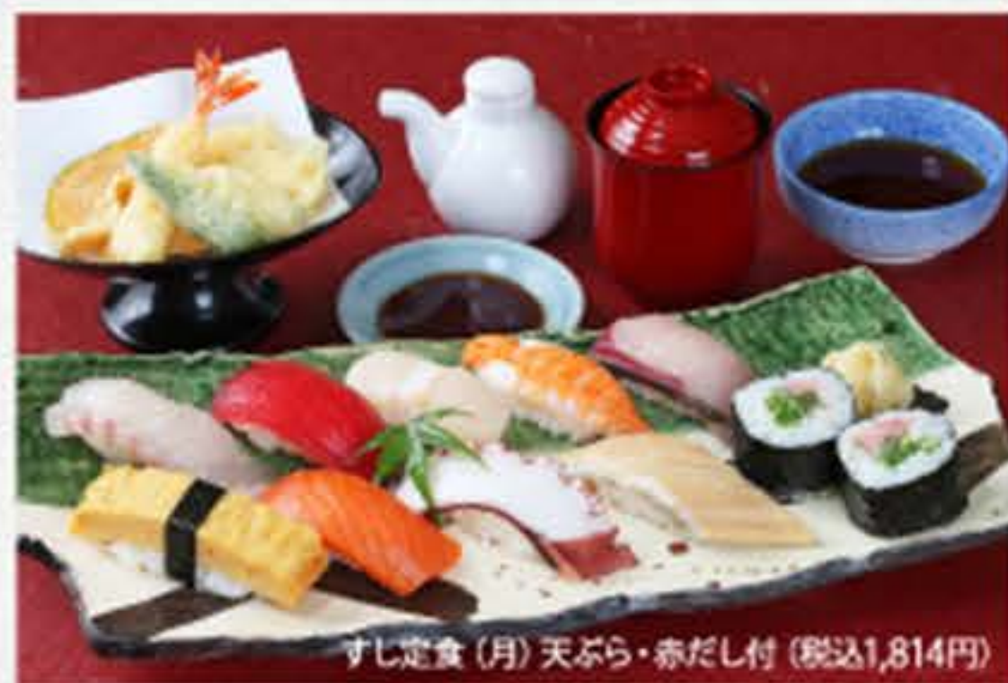
すし定食(月)天ぷら・赤だし付(税込1,814円)

赤だし付 880円 (税込950円) うどん又はそば付 1,080円 (税込1,166円) 天ぷら・赤だし付 1,380円 (税込1,490円)