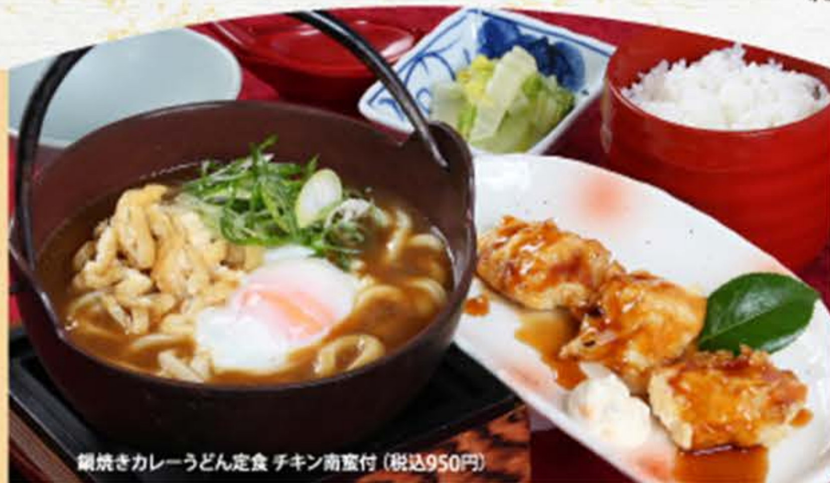
鍋焼きカレーうどん定食 チキン南蛮付 (税込950円)