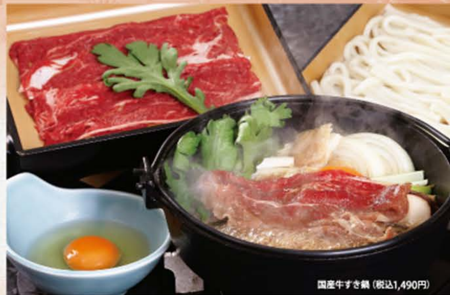
国産牛すき鍋 (税込1,490円)