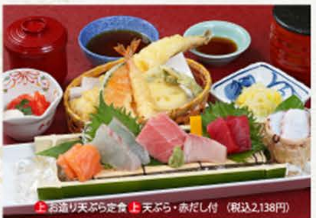
上 お造り天ぷら定食 上 天ぷら・赤だし付 (税込2,138円)

赤だし付 980円 (税込1,058円) うどん又はそば付 1,180円 (税込1,274円) 上 天ぷら・赤だし付 1,380円 (税込1,490円)