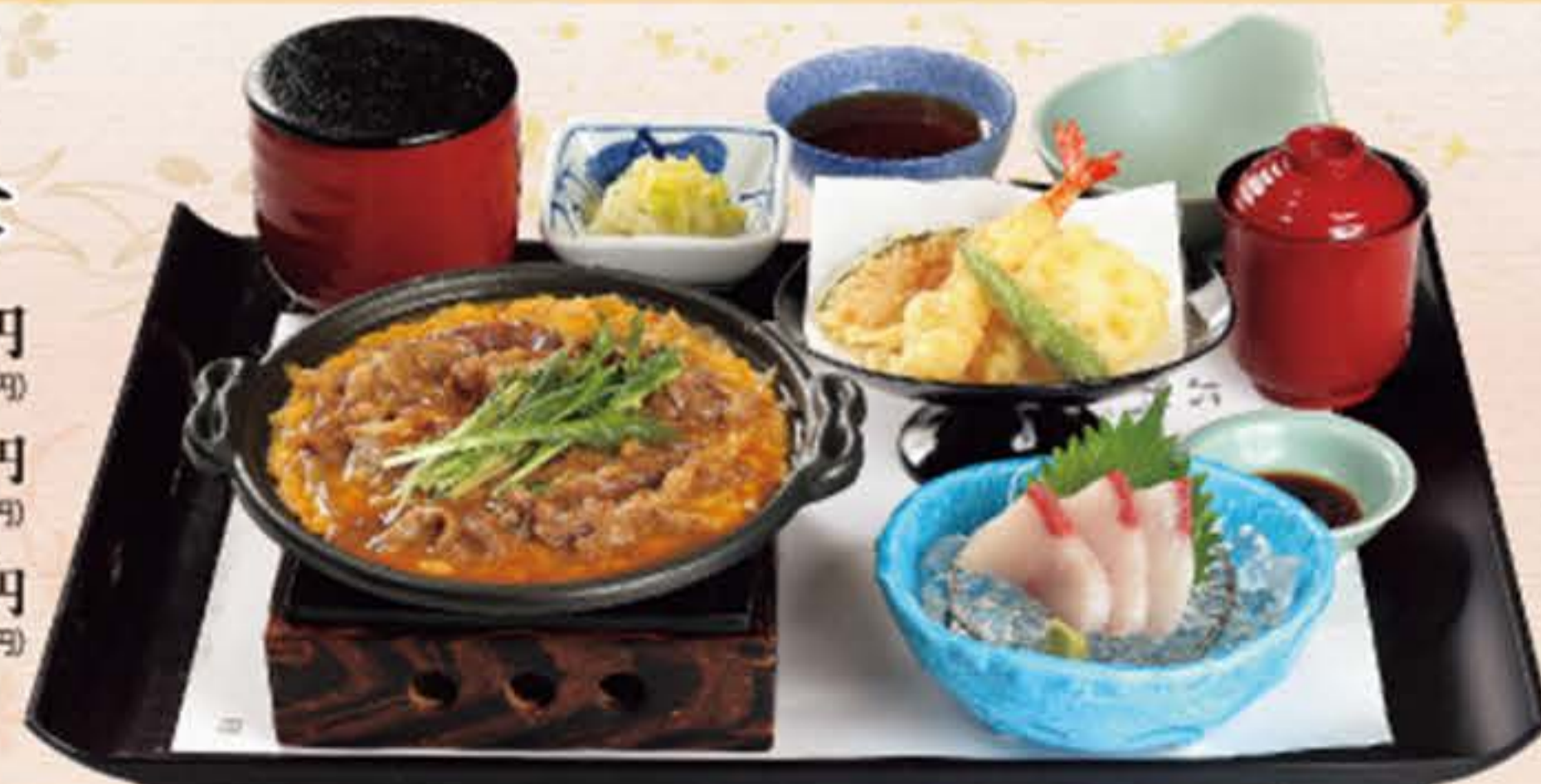
牛玉子とじ定食 天ぷら・ぶり造り・赤だし付 (税込1,598円)