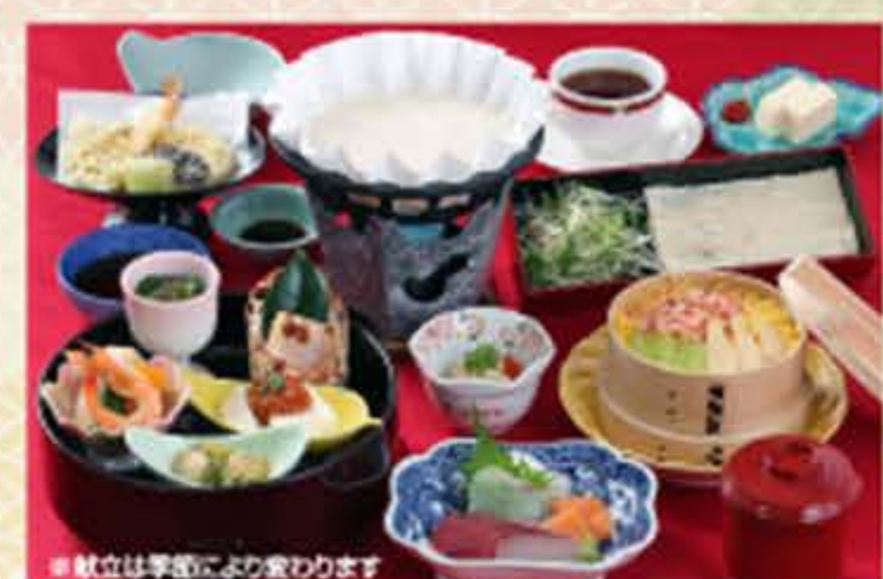
※献立は季節により変わります

前菜箱・造り・小鉢・天ぷら・桜えびと筒蒸し寿司・赤だし 午後3時入店迄はケーキ・コーヒー付