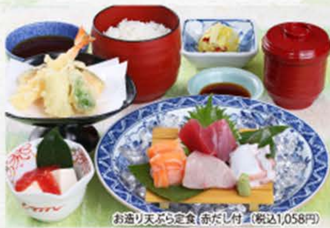
お造り天ぷら定食(赤だし付)(税込1,058円)

赤だし付 980円 (税込1,058円) うどん又はそば付 1,180円 (税込1,274円) ぶり造り・赤だし付 1,280円 (税込1,382円)