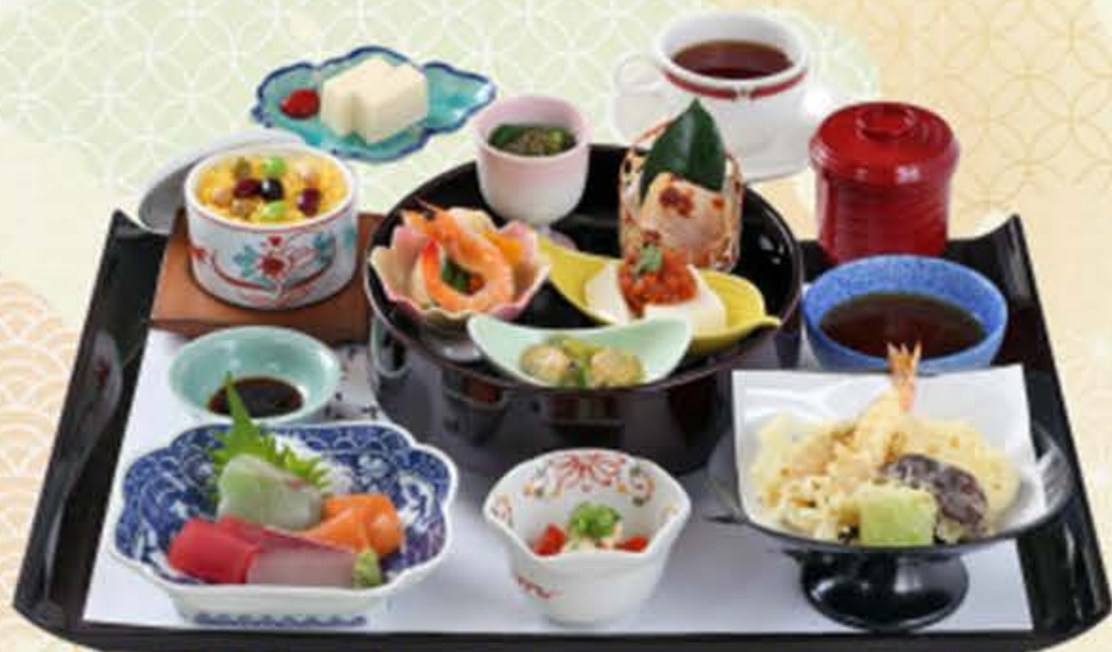
特別やわらぎ弁当 (税込1,922円) ※献立は季節により変わります

赤だし付 880円 (税込950円) うどん又はそば付 1,080円 (税込1,166円) ぶり造り・赤だし付 1,180円 (税込1,274円)