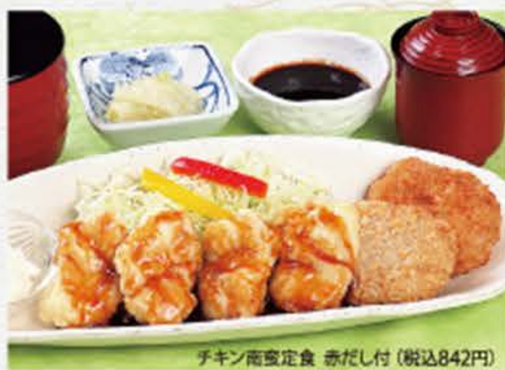
チキン南蛮定食 赤だし付(税込842円)

●うどんそばは 温・冷(常温)でも頂けます。 ●お造り天ぷら定食は 上・中・下(小鉢)の3種類があります。