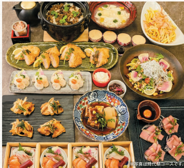
※写真は時代祭コースです