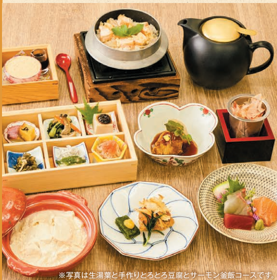
※写真は生湯葉と手作りとろとろ豆腐とサーモン釜飯コースです。