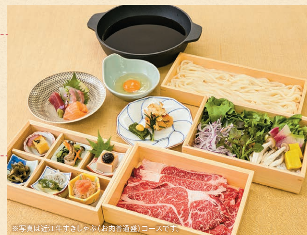
※写真は近江牛すきしゃぶ(お肉普通盛)コースです。

本日のおばんざい6種・お造り・鶏もも西京焼きと生麩田楽・近江牛すきしゃぶ・後うどん