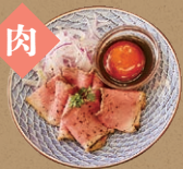
卵黄ソースの 国産牛ローストビーフ盛