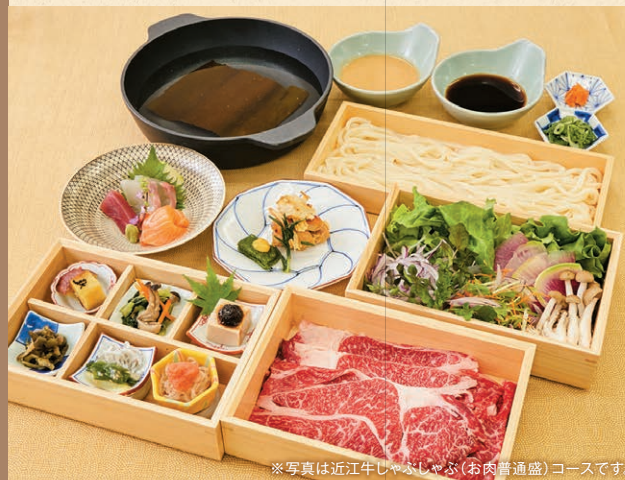
※写真は近江牛しゃぶしゃぶ(お肉普通盛)コースです。

本日のおばんざい6種・お造り・鶏もも西京焼きと生麩田楽・近江牛しゃぶしゃぶ・後うどん