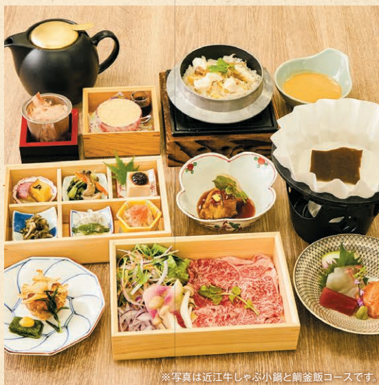
※写真は近江牛しゃぶ小鍋と鯛釜飯コースです。

本日のおばんざい6種・お造り・鶏もも西京焼きと生麩田楽・豚バラ大根・ぶぶ漬け出汁・豆乳ミルクくず餅(黒蜜きな粉)