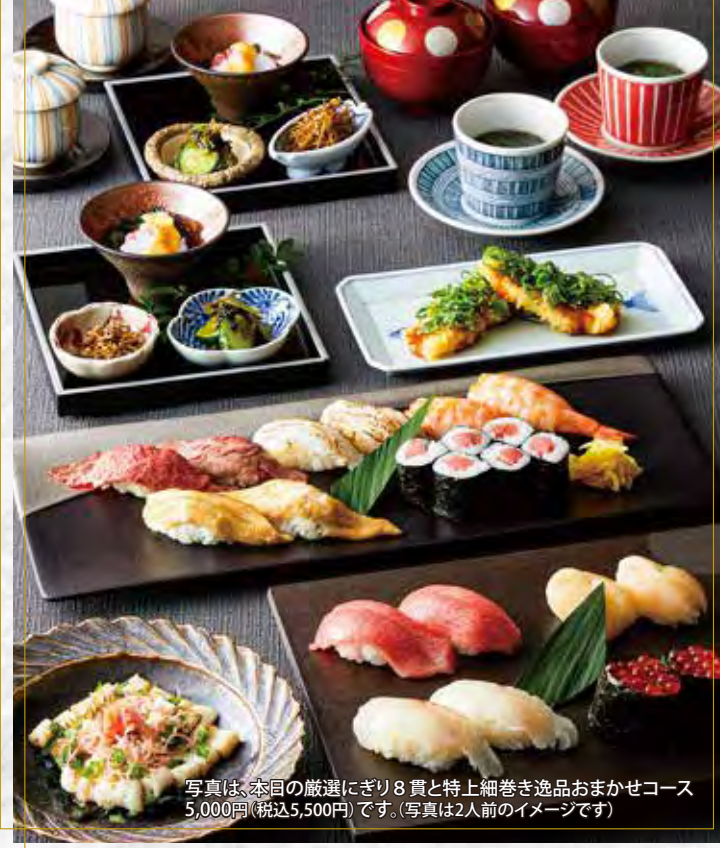
写真は、本日の厳選のにぎり8貫と特上細巻き逸品おまかせコース 5,000円(税込5,500円)です。(写真は2人前のイメージです)