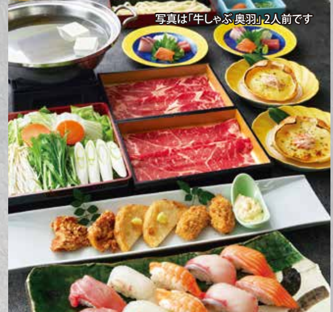
写真は「牛しゃぶ奥羽」2人前です