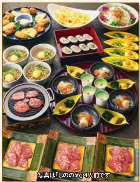
写真は「しのめ」4人前です