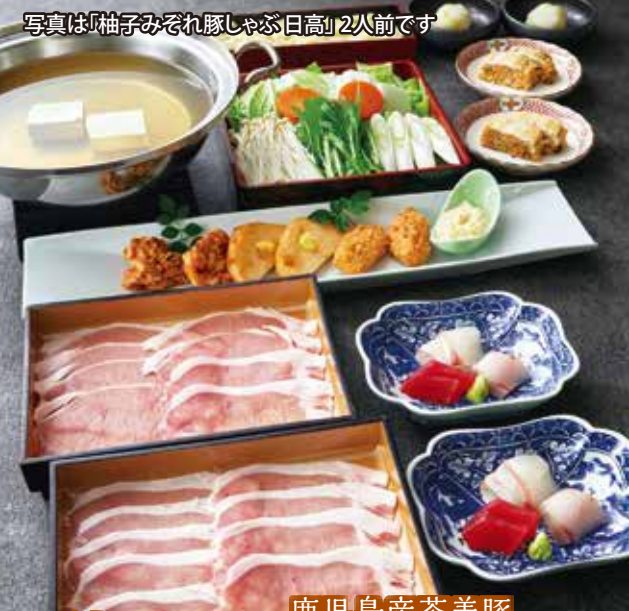
写真は「柚子みぞれ豚しゃぶ日高」2人前です