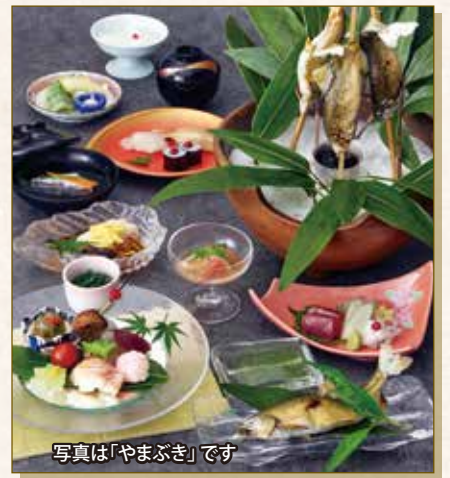
写真は「やまぶき」です