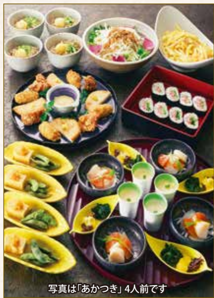
写真は「あかつき」4人前です