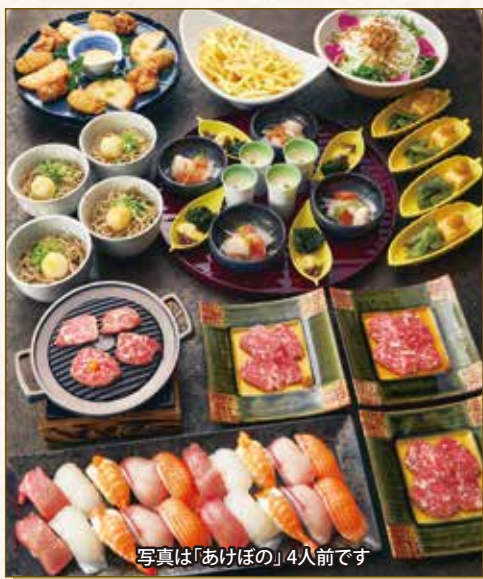
写真は「あけぼの」4人前です