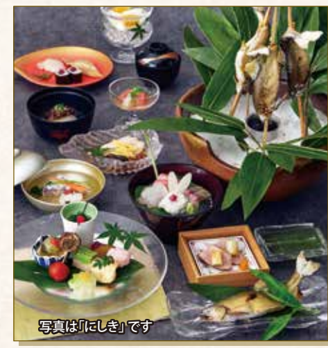
写真は「にしき」です