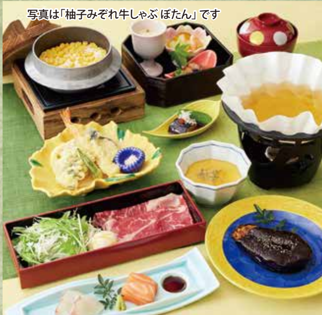
写真は「柚子みぞれ牛しゃぶぼたん」です