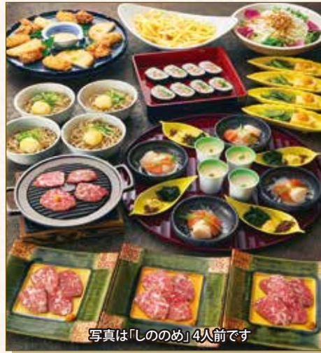
写真は「しののめ」4人前です