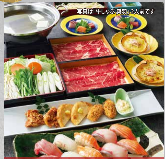
写真は「牛しゃぶ奥羽」2人前です

柚子みぞれ豚しゃぶ 奥羽 1人前 5,000円 柚子みぞれ豚しゃぶ・上造り 揚物盛合せ・かにグラタン すし盛合せ・めの麺 飲み放題 Aセット 6,500円 飲み放題 Bセット 7,000円