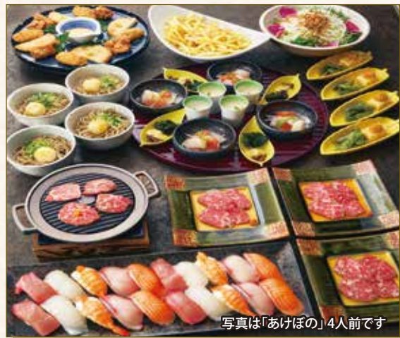
写真は「あけぼの」4人前です