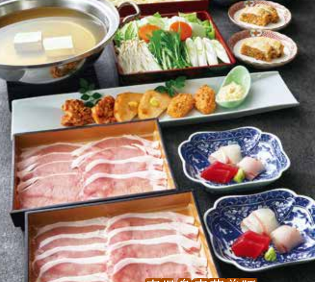
写真は「柚子みぞれ豚しゃぶ日高」2人前です