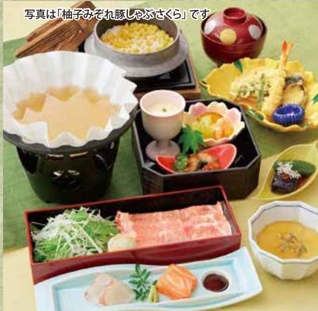
写真は「柚子みぞれ豚しゃぶさくら」です