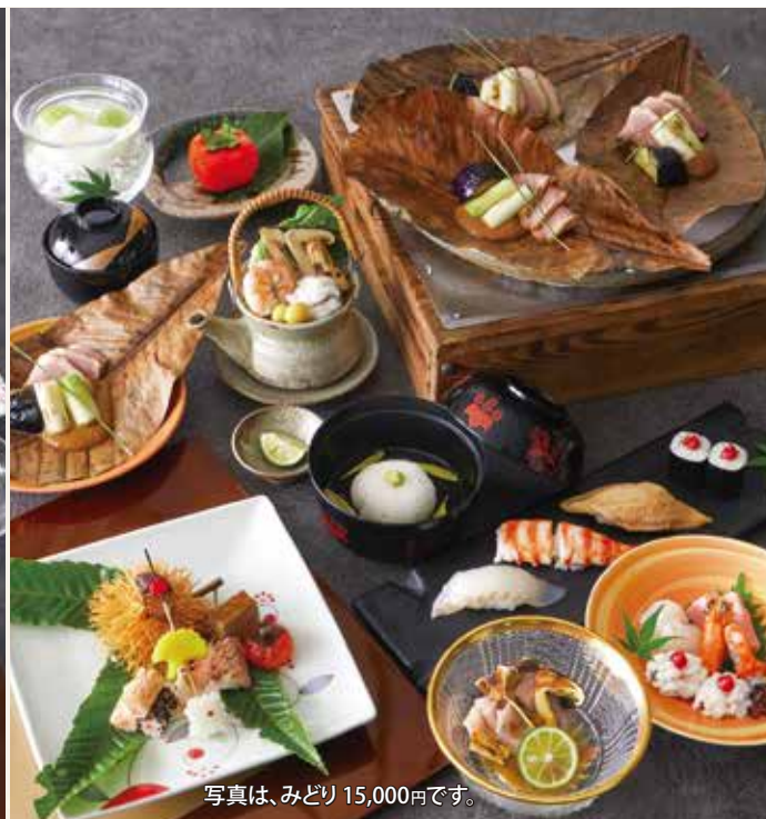
写真は、みどり 15,000円です。