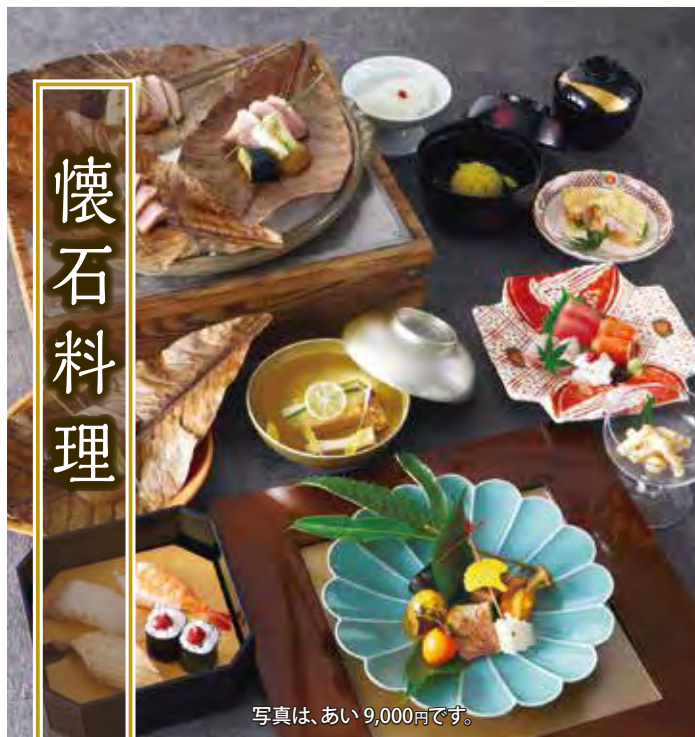
写真は、あい 9,000円です。