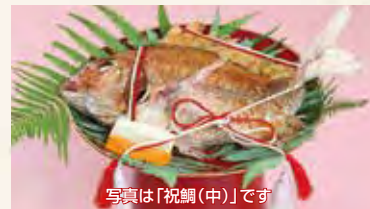
写真は「祝鯛(中)」です