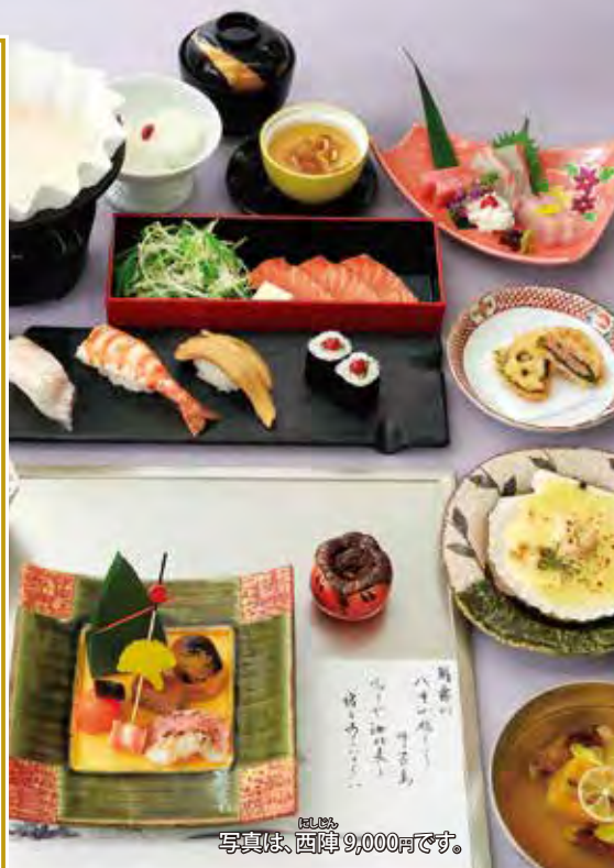
写真は、西陣 9,000円です。

法要とは、故人の冥福を祈り、追善供養を行う仏教の儀式です。故人が亡くなった日から数えて百日（に）四十九日まで行う「忌日法要」と、周忌（三回忌、七回忌、一十年単位で行う「年忌法要」）があります。