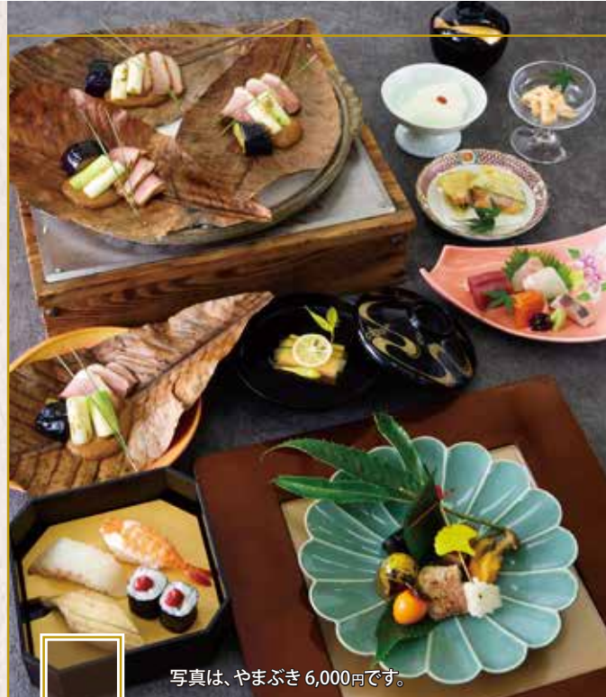
写真は、やまぶき 6,000円です。