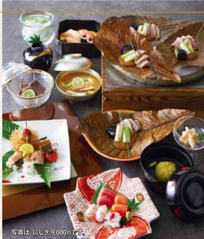
写真は、にしき 9,000円です。