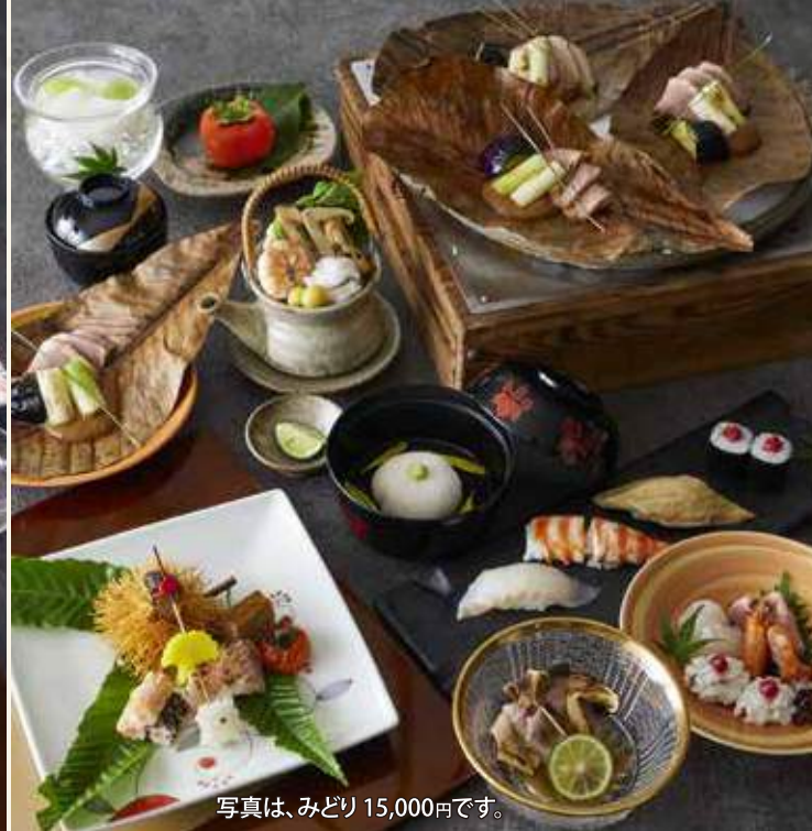
写真は、みどり 15,000円です。