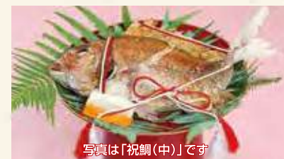
写真は「祝鯛(中)」です