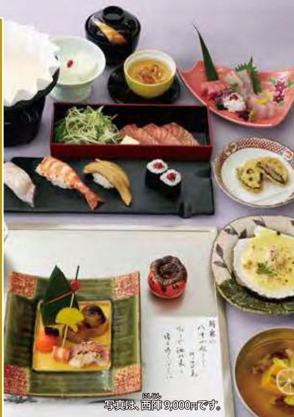
写真は、西陣 9,000円です。

法要とは、故人の冥福を祈り、追善供養を行う仏教の儀式です。故人が亡くなった日から数えて1日ごと、四十九日まで行う「忌日法要」と、一周忌、三回忌、七回忌、と年単位で行う「年忌法要」があります。