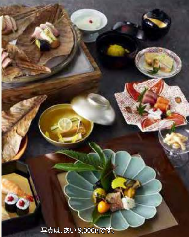
写真は、あい 9,000円です。