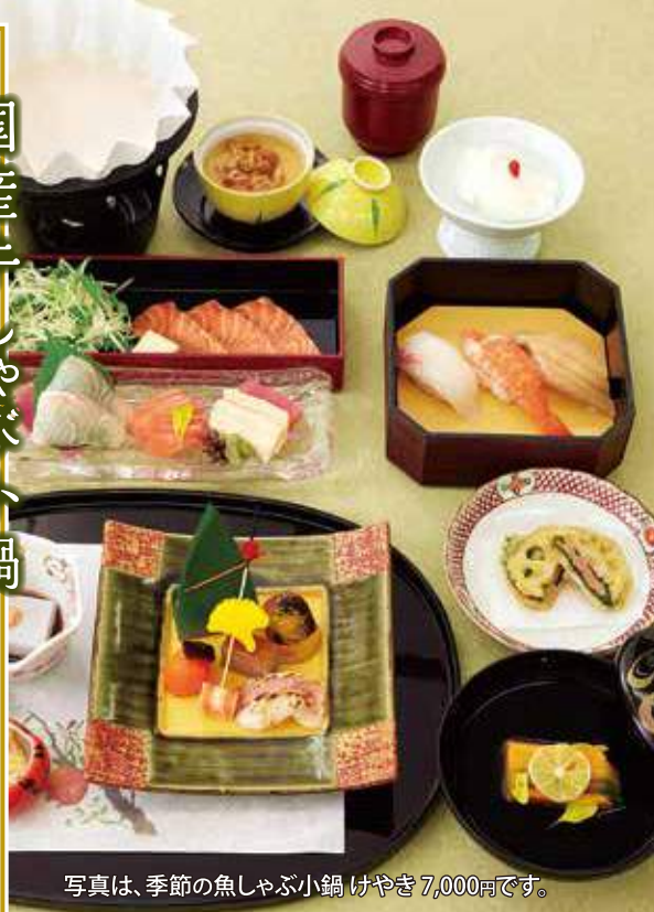
写真は、季節の魚しゃぶ小鍋 けやき 7,000円です。

国産牛しゃぶ小鍋 かえで 1人前 6,000円 又は 季節の魚しゃぶ小鍋 飲み放題付 8,000円