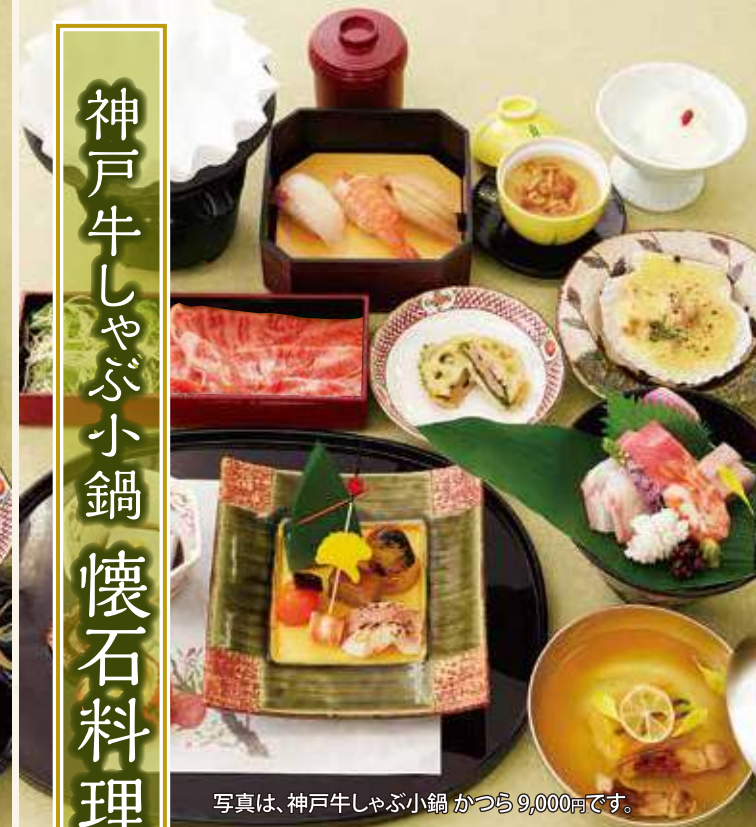
写真は、神戸牛しゃぶ小鍋 かつら 9,000円です。